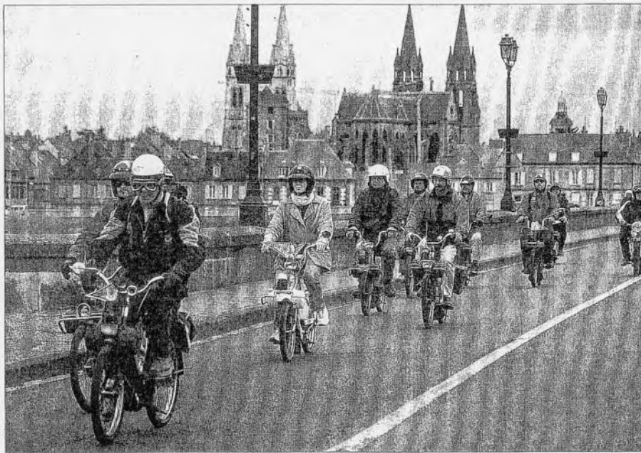
Le dimanche matin, les VéloSolexistes quittent Moulins en direction du bocage bourbonnais.

Depuis de nombreux mois, des quatre coins de l'Europe, on attendait l'Eurosolexine. Il fut à la hauteur des espérances et la campagne bourbonnaise, dans l'Allier, a frémi au son du VéloSolex tout le week-end de Pâques.