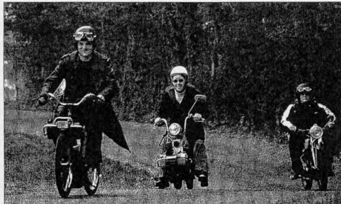
Les quelques rares raidillons de la promenade ont donné du fil à retordre au Micron (en seconde position). L'absence de pédales interdit toute aide musculaire...