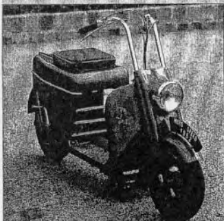
Une assistance rapprochée assurée en Speed Mors. Les Pétichons du Bourbonnais ont bon goût.

Goyon et un superbe scooter Speed Mors n'ont pas failli à leur tâche. Sécurité à un croisement, petit coup de pouce dans les côtes ou gros coup de main mécanique pour éviter la "punition" du camion ballet. Merci les môtards !